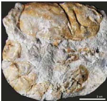
Obr. 1. Druh Hoploparia biserialis Fritsch, 1887, jedinec O 4044 (originál Friče, původní vyobrazení Fritsch – Kafka 1887, s. 35, text. obr. 56). Cephalothorax, abdomen a fragmenty pereio-podů. Spodní–střední turon, bělohorské souvrství, Bílá Hora v Praze.