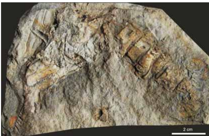
Obr. 4. Druh Glyphea bohemica (Fritsch, 1887), jedinec O 3490 (originál Friče, původní vyobrazení Fritsch – Kafka 1887, tab. 8, obr. 1). Cephalothorax, abdomen a fragmenty pereio-podů. Spodní–střední turon, bělohorské souvrství, Bílá Hora v Praze.

a silnější prsty s kratším ozubením. Rod Hoploparia má pleury na abdomenu delší, často trojúhelníkové a zřetelně zašpičatělé. Klepeta prvního páru pereio-podů jsou silná, asymetrická a dlouhá (delší než cephalothorax) a propodus má téměř obdélníkový tvar. Zatímco u zástupců rodu Hoploparia z české křídové pánve se podařilo vymezit čtyři druhy na základě morfologického srovnání tvaru a rýh na cephalothoraxu a tvaru klepet prvního páru pereio-podů, u rodu Oncopareia se cephalothorax zachoval pouze u jednoho exempláře a všechny tři druhy byly vymezeny jen na základě studia abdomenu a prvních pereio-podů.