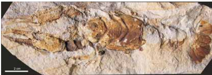
Obr. 3. Druh Enoploclytia leachi (Mantell, 1822), jedinec O 4042 (originál Friče, původní vyobrazení Fritsch – Kafka 1887, s. 29, text. obr. 49). Celý jedinec s cephalothoraxem, prvními třemi páry pereio-podů a abdomenem. Spodní–střední turon, bělohorské souvrství, Bílá Hora v Praze.