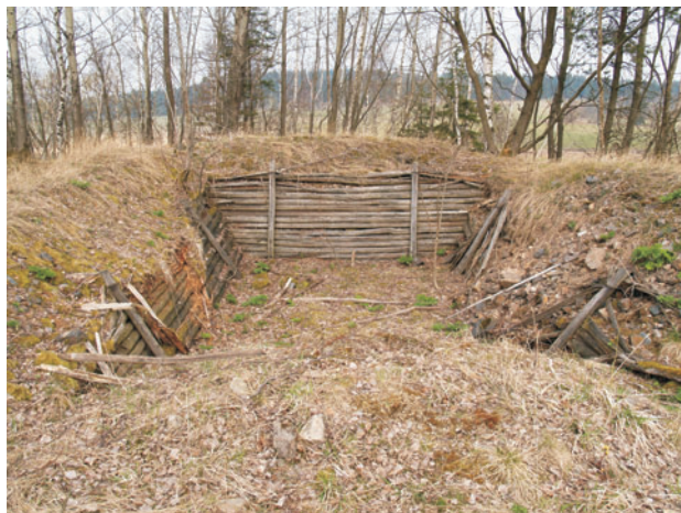
Obr. 5. Okop pro vojenskou techniku v odvalu hlušiny po těžbě uranu severně od bývalého města Čistá.

(tedy pravděpodobně i hornické) přetvořeny silným antropogenním tlakem, který souvisel po odsunu německého obyvatelstva s poválečnou přeměnou území na vojenský prostor Prameny v období 1947–1954. V oblasti byly vybudovány okopy pro vojsko i techniku, betonové pevnůstky, účelové komunikace. Armáda opustila prostor v roce 1954, neboť do území vstoupila další politicky a strategicky vedená aktivita – těžba uranové rudy. Ukončení vojenské činnosti bylo spojeno s likvidací zbytků vesnic, v zájmovém území byla zcela destruována Čistá, patrně jsou základy domů, vchody do sklepů. Vojenská činnost narušila vodní režim krajiny, závlahové a odvodňovací stavby, poničila komunikační síť (Tomíček 2006). Tehdy mohlo dojít i k likvidaci povrchových projevů historické těžby cínu (pinek) v okolí Dolu Jeroným.