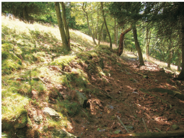
Obr. 4. Zemědělské terasy na příkrém pravém údolním svahu Cínového potoka umožňovaly i zadržování a odvádění vody.