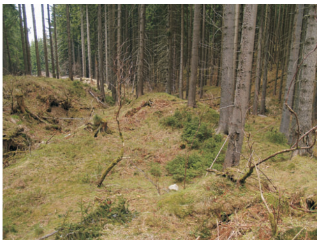
Obr. 3. Odvaly po historické těžbě a úpravě cínu v údolí Cínového potoka.

potoka je vyústění dědičné štoly Dolu Jeroným, v horní části toku se údolí rozevírá, časté je zamokření, vyskytují se rybníky i zbytky protržených rybníčních hrází. Morfologicky málo patrné jsou tam pozůstatky základů stavebních objektů a starých cest po zaniklé osadě Chalupy (Eherlich) na levém svahu potoka. Nejrozsáhlejší zbytky sídelních tvarů zde zůstaly po bývalém městě Čistá na plošině hlavního rozvodního hřbetu. Na příkrých svazích uvedených vodních toků jsou časté zemědělské terasy, dokládající předcházející zemědělské hospodaření.