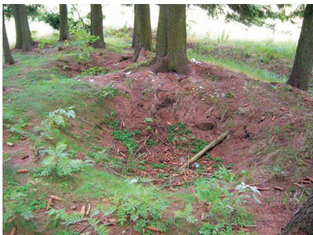
Obr. 2. Výrazné pinky v oblasti Opuštěná důlní díla Dolu Jeroným.