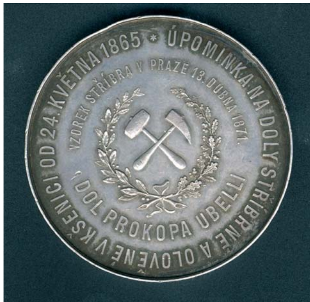
2. Rubní strana medaile s hornickým motivem ve věnci a dvojitým českým opisem.